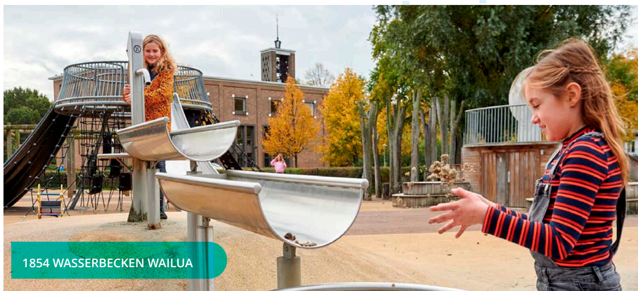
1854 WASSERBECKEN WAILUA