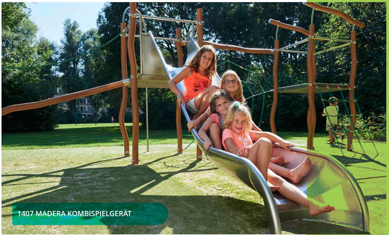
1407 MADERA KOMBISPIELGERÄT