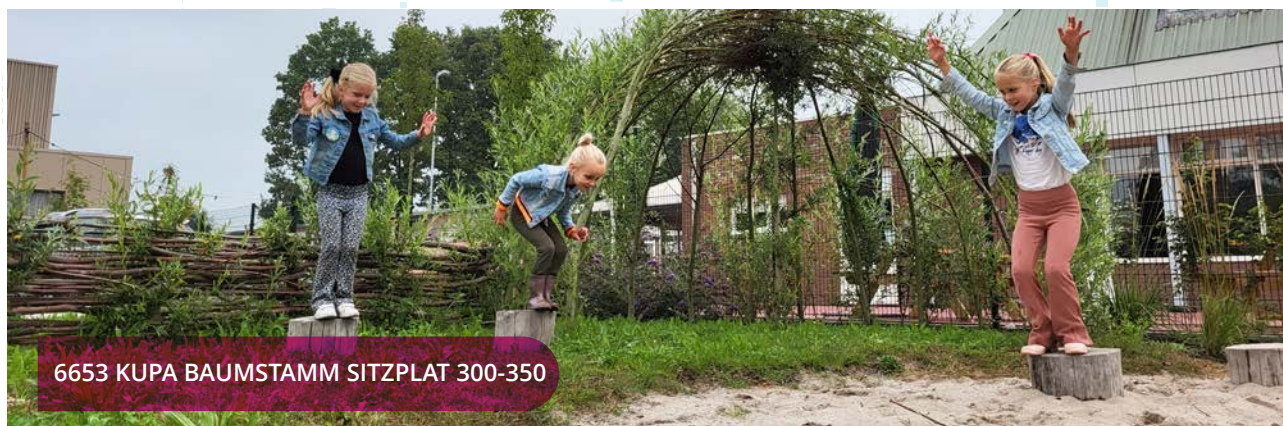
6653 KUPA BAUMSTAMM SITZPLAT 300-350