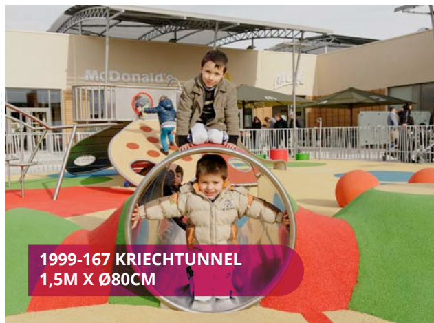
1999-167 KRIECHTUNNEL 1,5M X Ø80CM