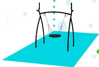
BUILDING BLOCK A

Die Hauptfunktion des Building Block C ist Drehen. Auf diesem Building Block können jedoch auch Wippen montiert werden. Building Block C MINI hat einen kleineren Durchmesser.