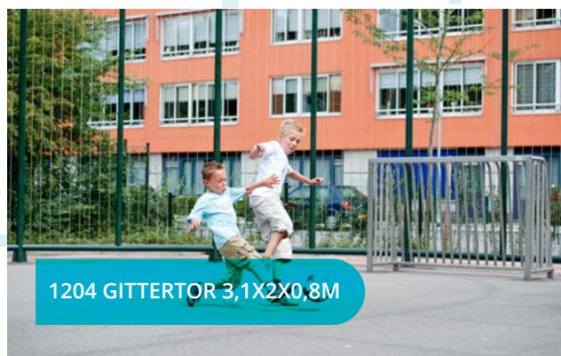
1204 GITTERTOR 3,1X2X0,8M