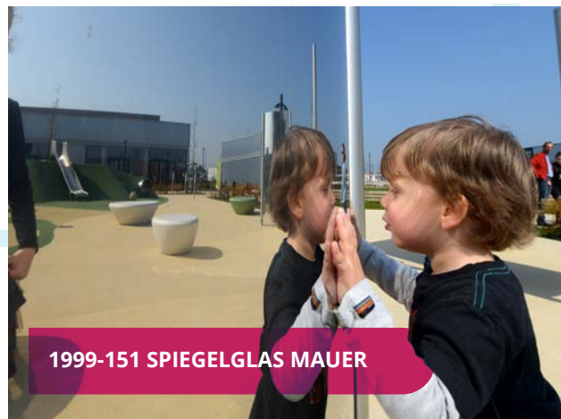
1999-151 SPIEGELGLAS MAUER