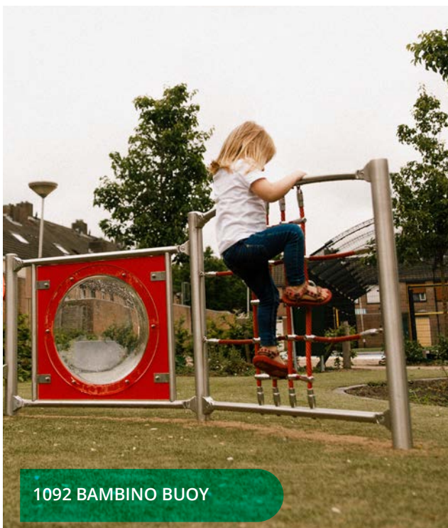
1092 BAMBINO BUOY