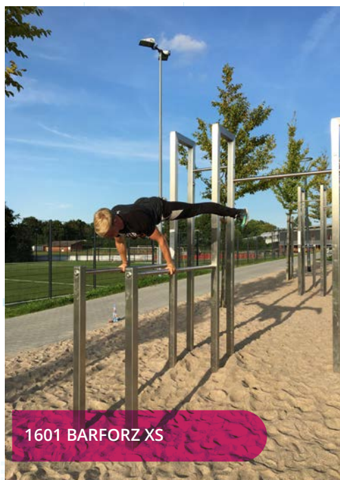
1601 BARFORZ XS