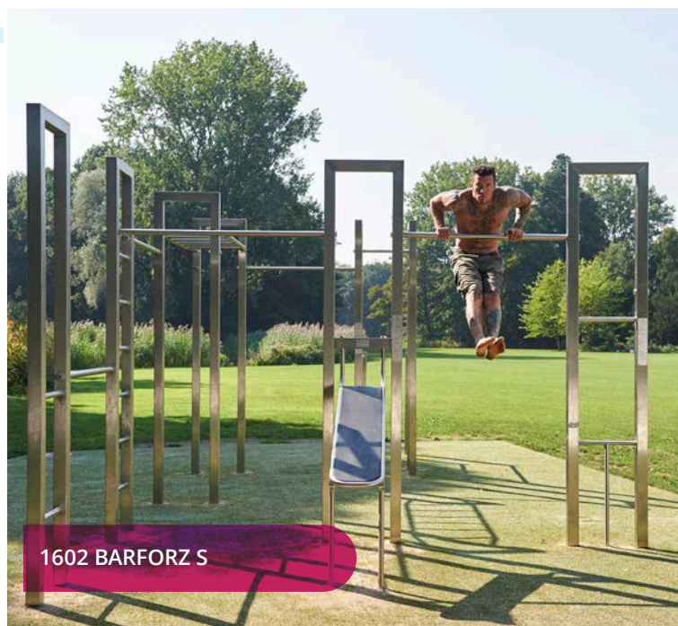
1602 BARFORZ S