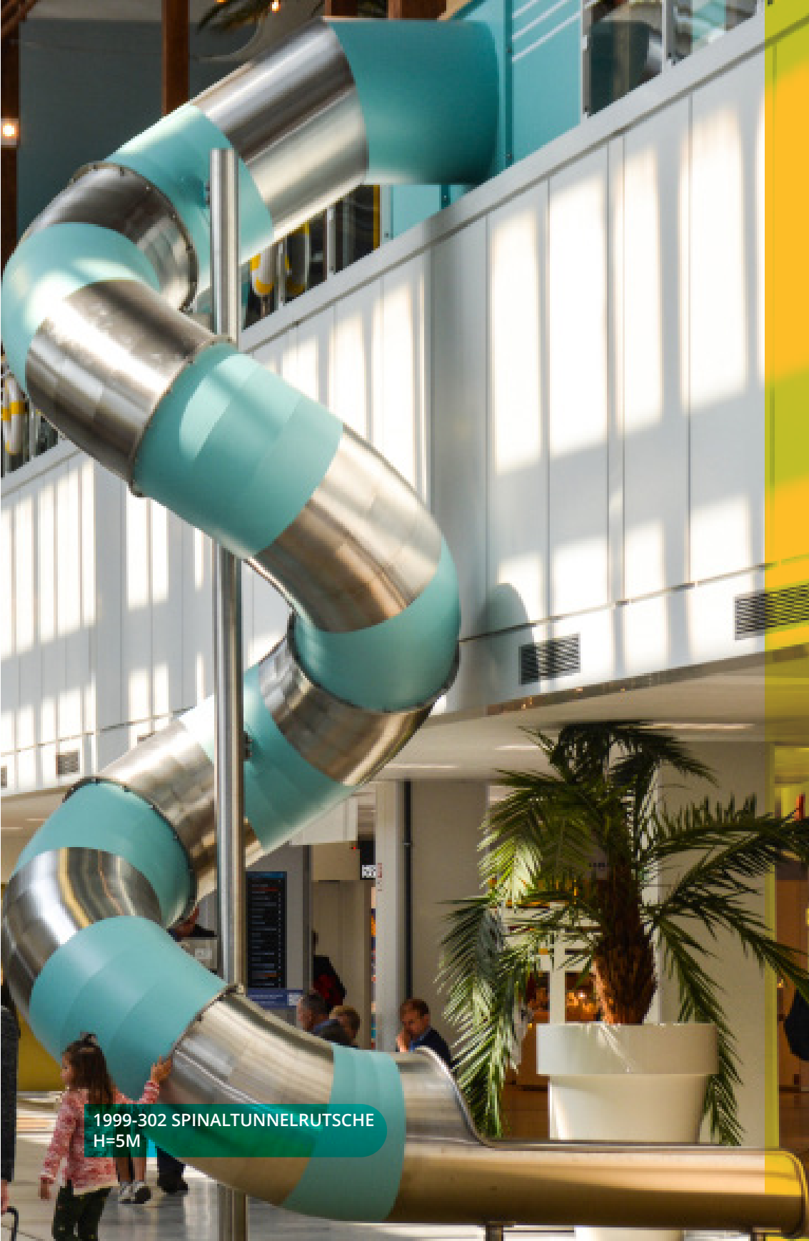
1999-302 SPINALTUNNELRUTSCHE H=5M