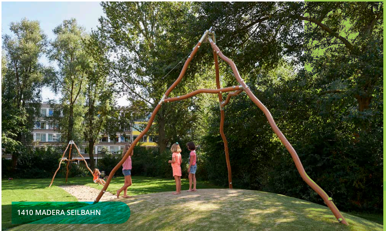
1410 MADERA SEILBAHN

*Preise in Euro, zzgl. MwSt., netto und ab Werk. Exklusiv Frachtkosten. | P.a.A.: Preis auf Anfrage | Die Preise für Fundamente sind nicht im Preis des Spielgeräts enthalten und werden separat erwähnt. Technische Anpassungen und Preisänderungen vorbehalten. Die Preise sind gültig vom 01.02.2024 bis einschließlich 31.01.2025.