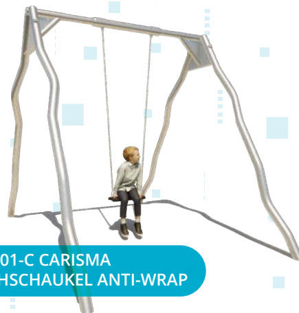
CS-1-EA01-C CARISMA EINFACHSCHAUKELE ANTI-WRAP