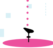
BUILDING BLOCK C