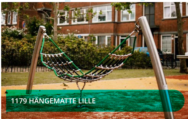
1179 HÄNGEMATTE LILLE