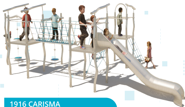
1916 CARISMA KOMBISPIELGERÄT XL