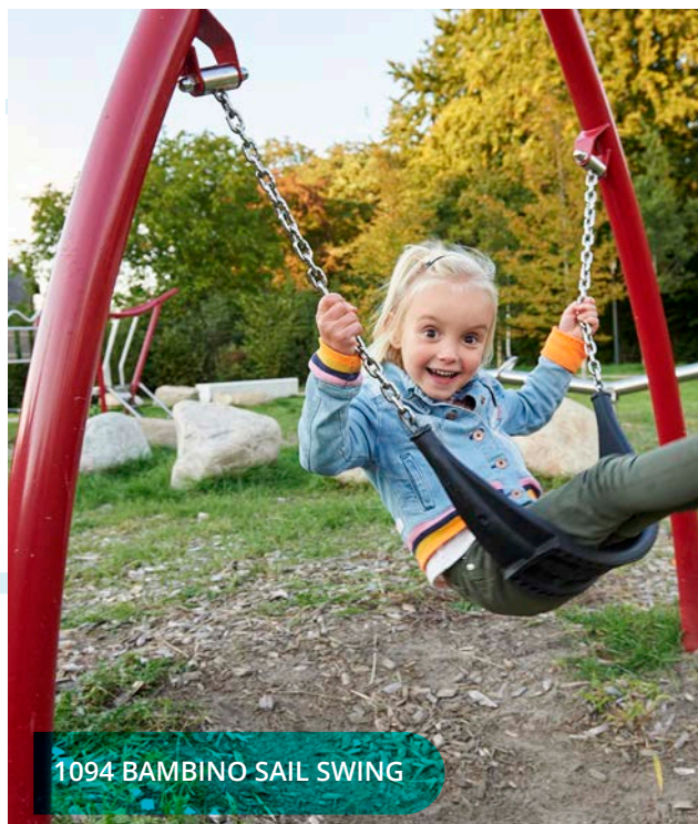
1094 BAMBINO SAIL SWING