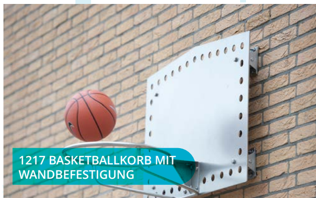
1217 BASKETBALLKORB MIT WANDBEFESTIGUNG