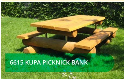
6615 KUPA PICKNICK BANK