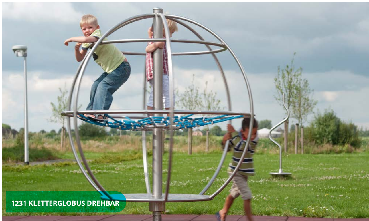
1231 KLETTERGLOBUS DREHBAR