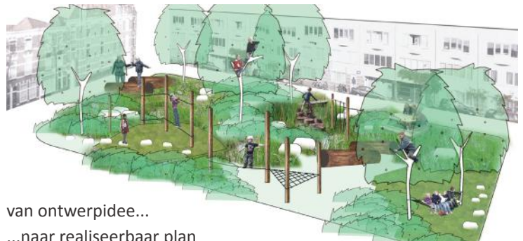
van ontwerpidee... ...naar realiseerbaar plan

Een professionele ontwerper werkt het winnende plan uit. Dit definitieve plan wordt via de website bekend gemaakt.