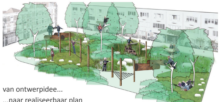
van ontwerpidee... ...naar realiseerbaar plan

Een professionele ontwerper werkt het winnende plan uit. Dit definitieve plan wordt via de website bekend gemaakt.