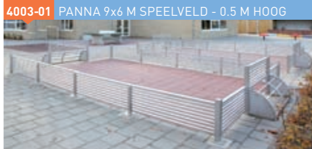
4003-01 PANNA 9x6 M SPEELVELD - 0.5 M HOOG