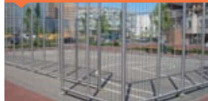
DAKNET - ALLEEN BIJ 4 M HOOG